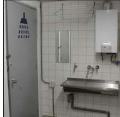
Douche en wasbak